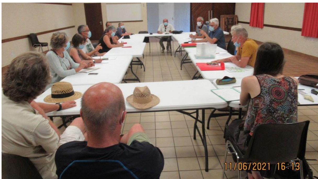
Tour de table,