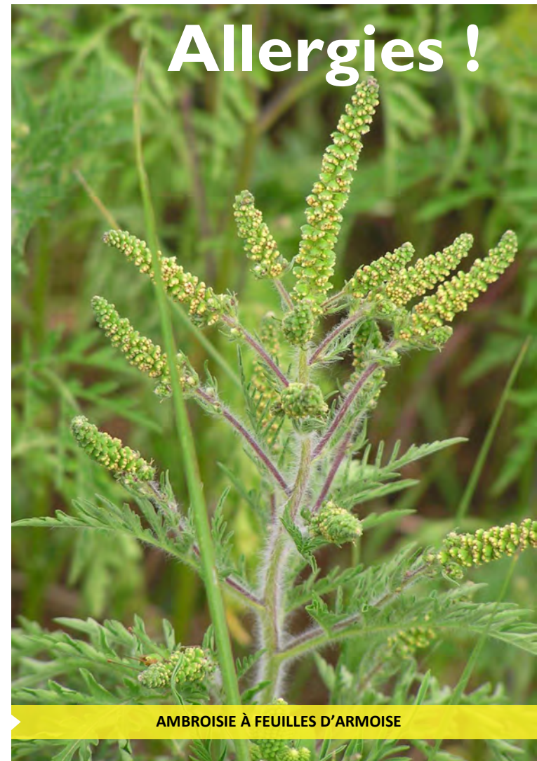
AMBROISIE À FEUILLES D'ARMOISE